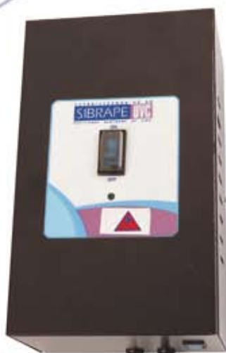
Caixa de Monitoramento