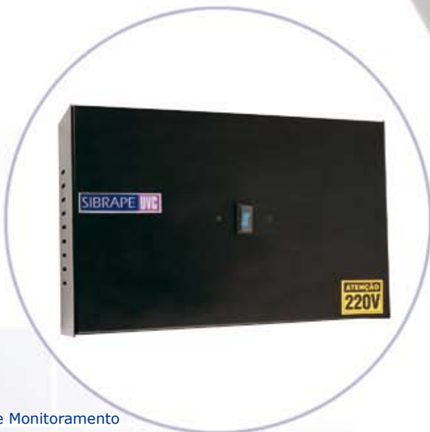
Caixa de Monitoramento