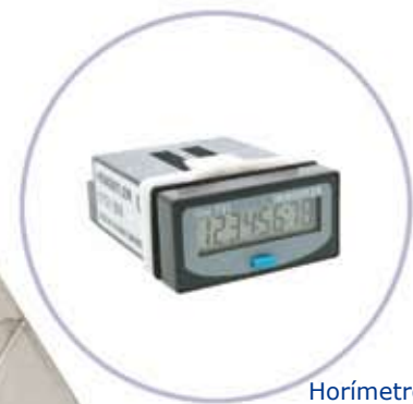
Horímetro *Acessório da Caixa de Monitoramento